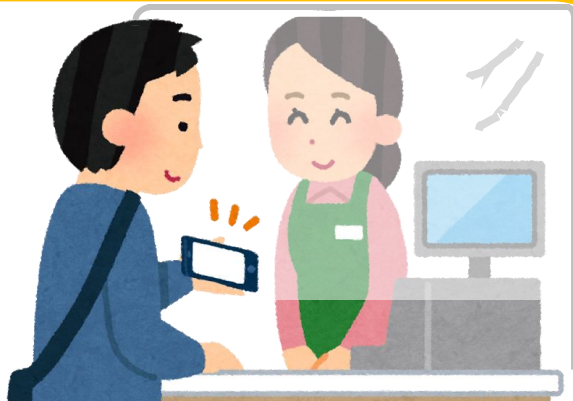
キャッシュレス化支援 POSレジ導入・データ分析