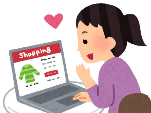
WEB活用支援(EC活用含む) ネットショップ構築